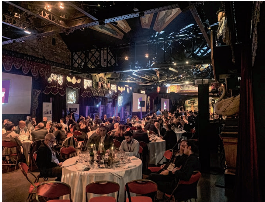
Tous les deux ans, le dîner de l'AN2V réunit industriels de la vidéosurveillance et décideurs publics.