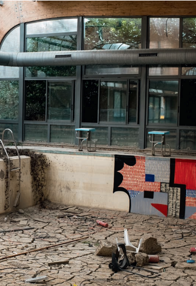
La piscine de Breil-sur-Roya n'a jamais été réhabilitée après le passage de la tempête Alex en 2020.