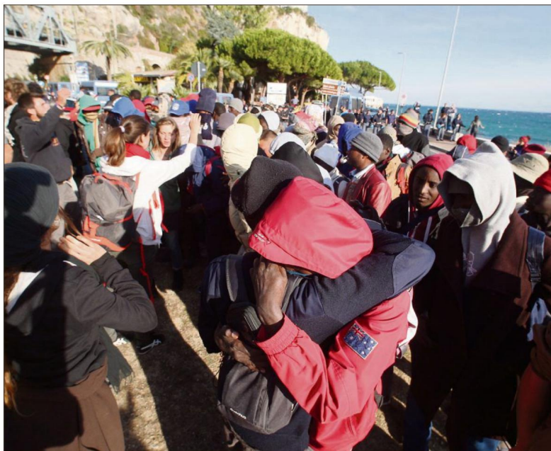
Le 30 septembre, la police italienne avait fait évacuer le camp non-officiel, mettant fin à trois mois d'occupation et de tension à la frontière franco-italienne.