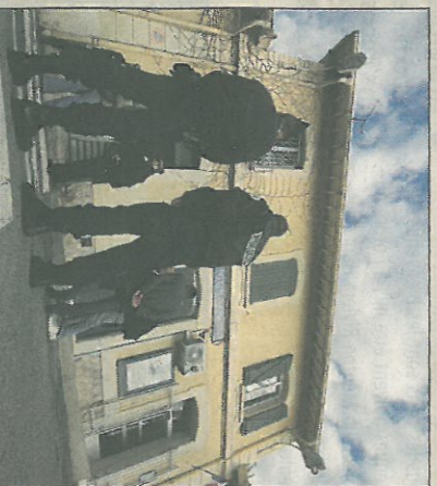
Les participants réclament un État à la hauteur des enjeux.