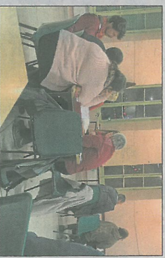
Un travail en ateliers.